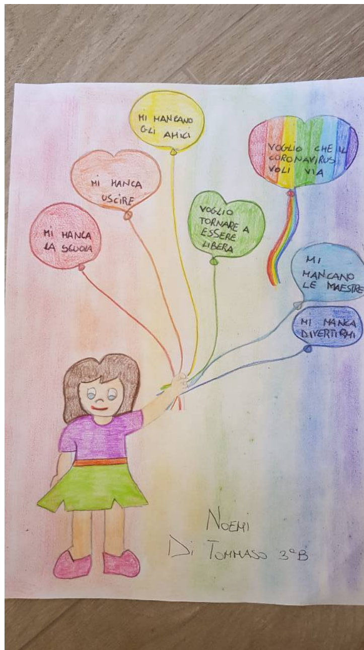
NOEMI (sopra) E SOFIA (sotto)