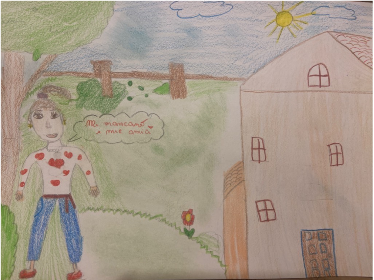
EVA (sopra) E TOMMASO (sotto)